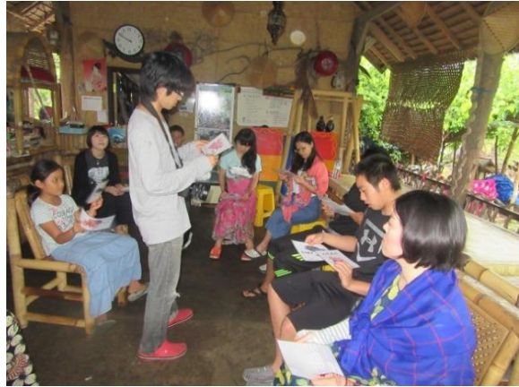
ギリ・メノ島で海プログラム体験