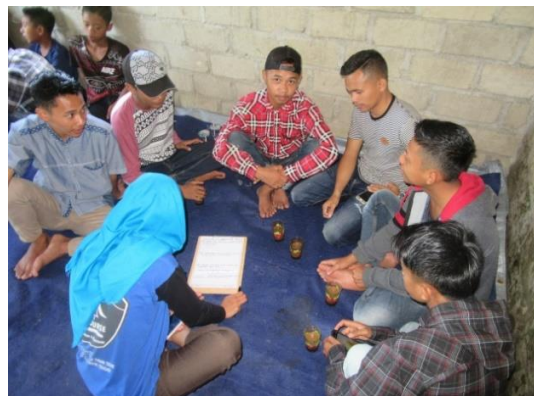
WS 1 回目（グループワーク）