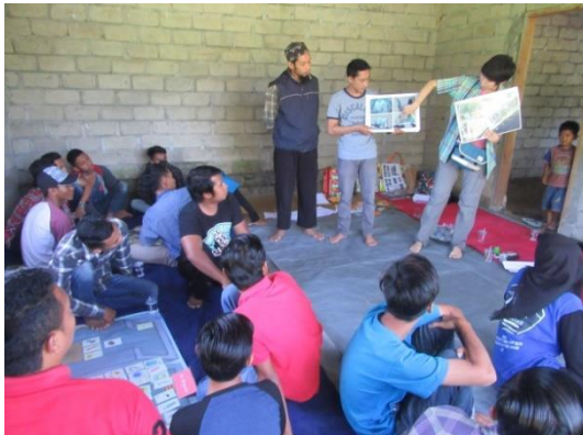
WS 1 回目（プログラム実施）