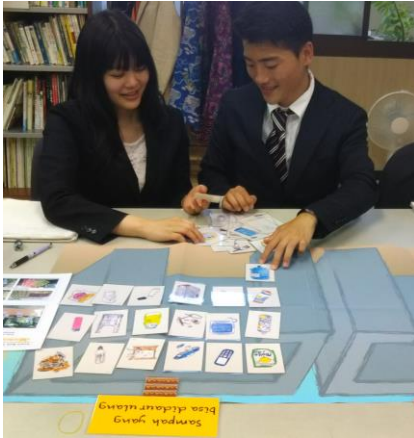
5月19日プログラム体験の様子