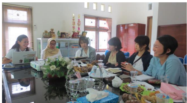
JICA 青年海外協力隊員と意見交換