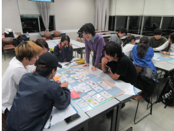
10月23日のプログラムの様子