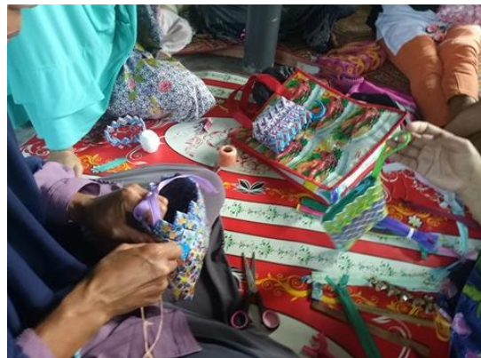
3月2回目の講習会の様子