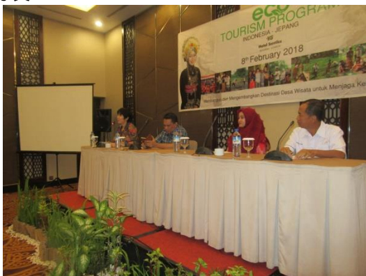
フォーラムの様子