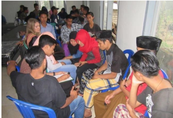
WS 2回目（グループワーク）