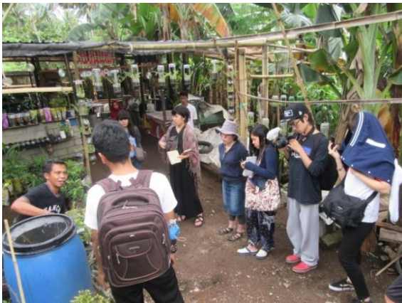
クカイ・ブルスリごみ銀行見学