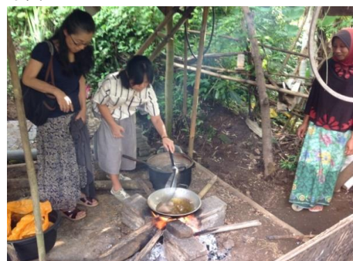
マスマス村への見学ツアー