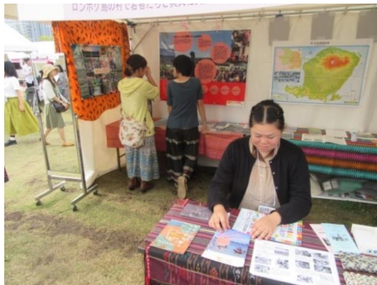
グローバルフェスタ 2017