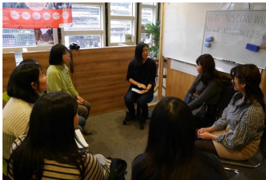
グループでのおしゃべりタイム