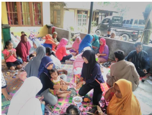
3月1回目の講習会の様子