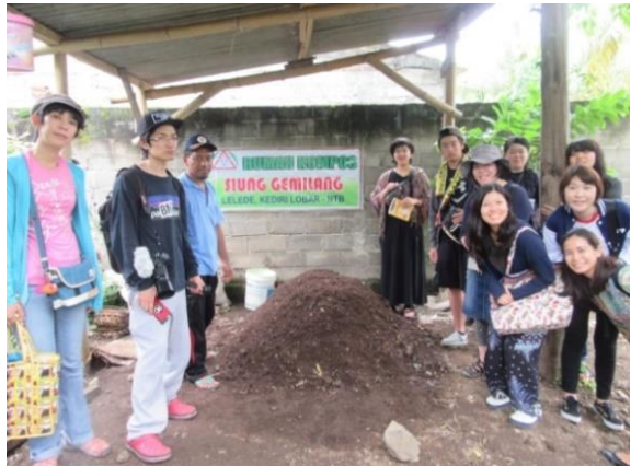
シウン・グミランごみ銀行見学