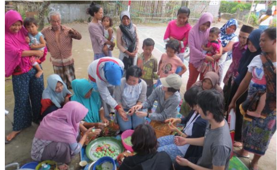
伝統菓子づくり体験