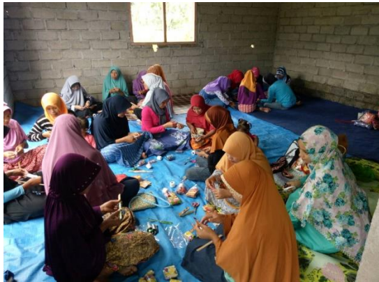
8月の講習会の様子（ランタン村）