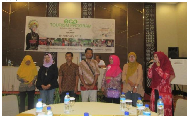
ウダヤナごみ銀行ティア氏のプレゼン